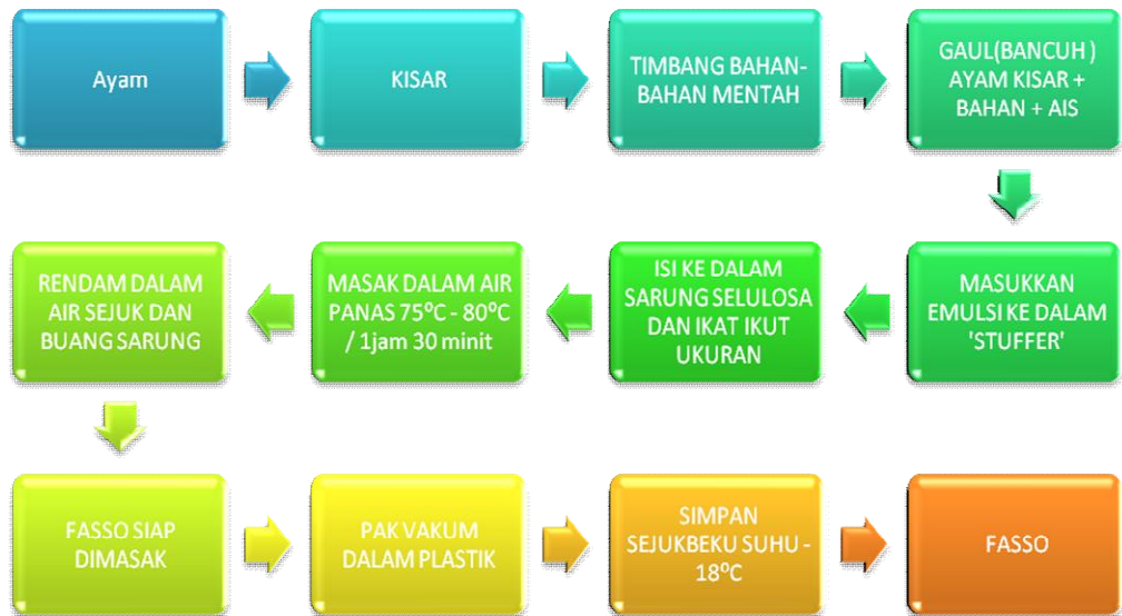
Carta alir pemrosesan Fasso