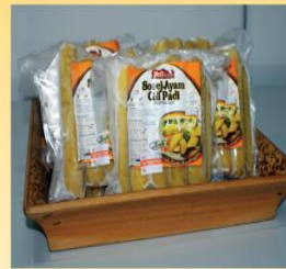
Sosej Ayam Cili padi Dengan Pelekat Label