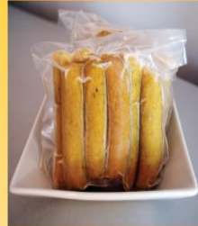
Sosej Ayam Cili padi Tanpa Label