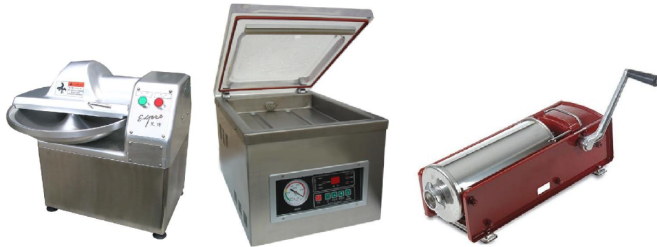
CHOPPING MACHINE VACUUM PACK MANUAL STUFFER MACHINE

Foto/illutrasi yang menerangkan inovasi samada produk, proses, teknologi, peralatan dan yang berkaitan yang menerangkan sebelum dan selepas inobasi, kelebihan inovasi dari segi kualiti, kuantiti, kos dan lain-lain yang berkaitan.