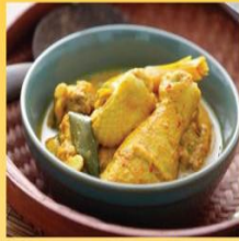
Masak Lemak Cili padi