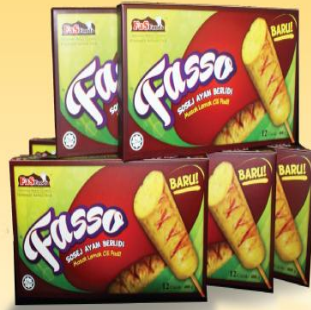
Ayam Masak Lemak Cili padi Ber lidi